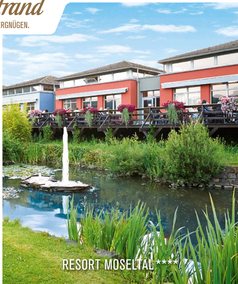
RESORT MOSELTAL ****

Erholung und Entspannung in den schönsten Urlaubsregionen Deutschlands – in Fintel und Leiwen. Erleben Sie ein kulinarisches Programm der Extraklasse mit unseren zahlreichen Events.